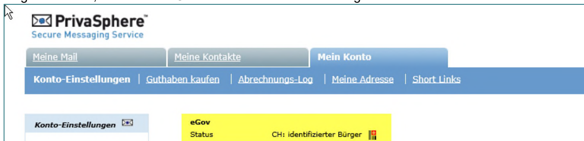
Abbildung 2: Screenshot ab www.privasphere.ch