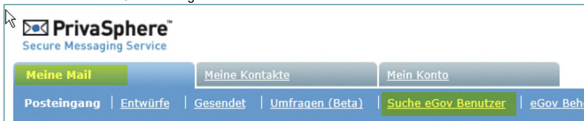
Abbildung 3: Screenshot ab www.privasphere.ch