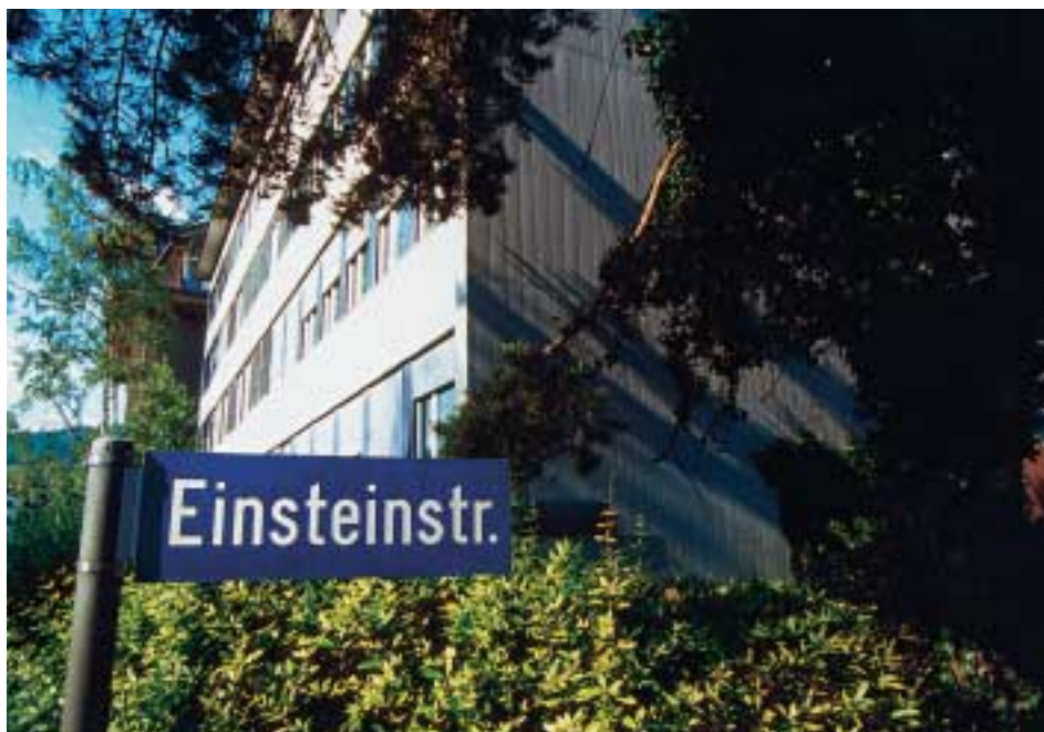
Das Eidg. Institut für Geistiges Eigentum in Bern (im Bild) ist das Kompetenzzentrum des Bundes für Anliegen zu den Themen Marken, Patente, Designs und Urheberrechte. Die gemeinwirtschaftlichen Leistungen werden in erster Linie durch die Abteilung Recht & Internationales erbracht.

Als Kompetenzzentrum des Bundes für Immaterialgüterrecht sorgt das Eidg. Institut für Geistiges Eigentum (IGE) auf nationaler Ebene für die Schaffung der notwendigen rechtlichen Rahmenbedingungen zum Schutz von Geistigem Eigentum. Dies betrifft vor allem Marken, Patente, Designs und Urheberrechte. Das Institut hat zudem den gesetzlichen Auftrag, die Interessen der Schweiz in den entsprechenden internationalen Organisationen wirksam zu vertreten. Diese Aufgaben werden hauptsächlich von der Abteilung Recht & Internationales des IGE wahrgenommen, welche damit zur «Anwaltskanzlei» des Bundes für Geistiges Eigentum wird.